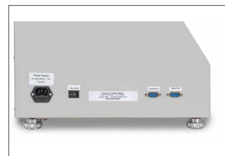
Interfaccia per la trasmissione di dati p. es. dal dinamometro SAUTER FH e per il comando del banco di prova con il software SAUTER AFH