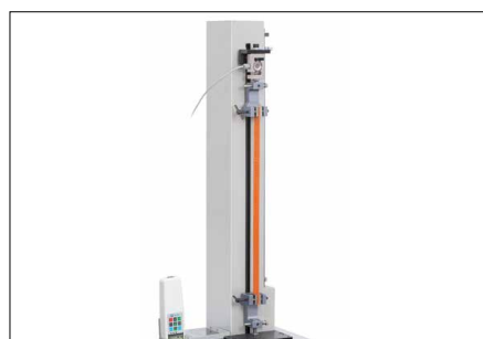
Numerose possibilità di utilizzo grazie alla corsa più ampia