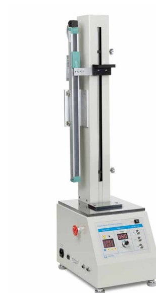
Banco di prova motorizzato incl. sistema di misurazione della lunghezza LD