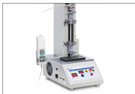
Opzioni di montaggio solide e flessibili di numerosi morsetti e accessori della gamma SAUTER, vedi Accessori